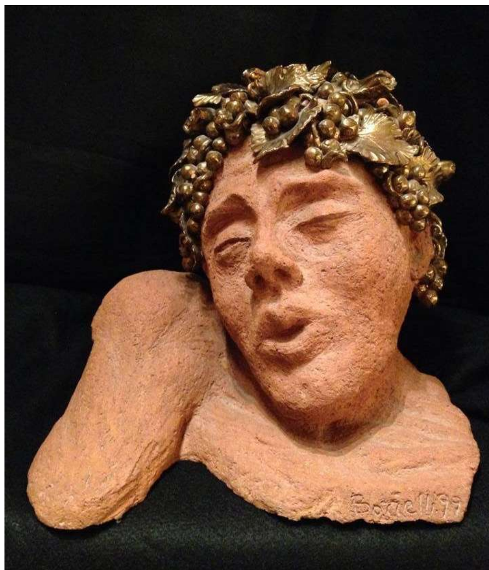
Refrattario rosso con decorazione d'uva in oro brunito a 3°fuoco Dimensioni: L32 x P30 x H29 cm - anno 1999

Napoli Cell 3409884069 Email- borale1969@gmail.com www.alessandro-borrelli.webnode.it