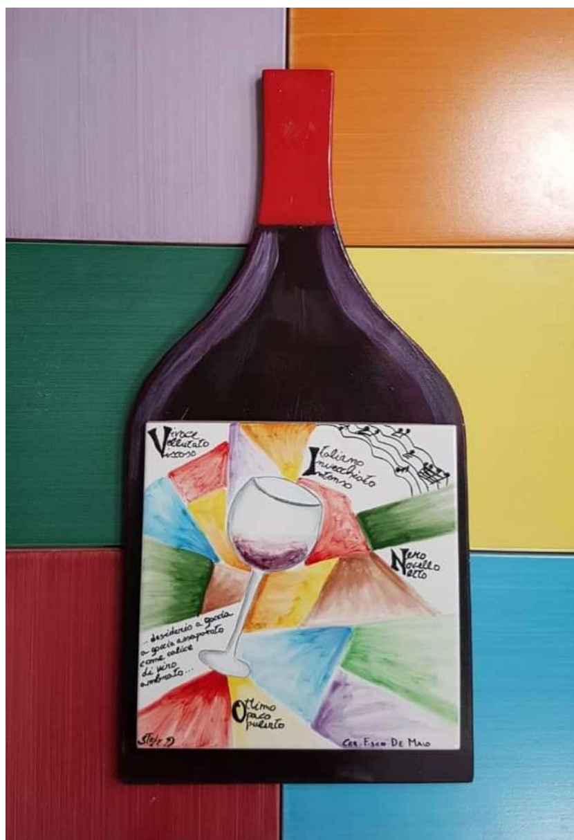
Dim. 15 x 32 cm – anno 2019

Via T. Gaudiosi 18 84013, Cava De' Tirreni (SA) Cell 3401687750 Email- sonorika1971@gmail.com